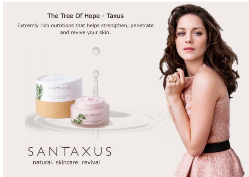
圖:報告的廣告稿的一個