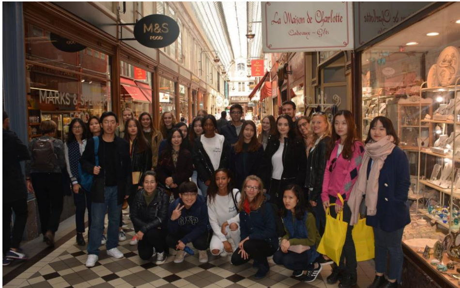
圖:學校帶的景點參觀。第一次與第二次