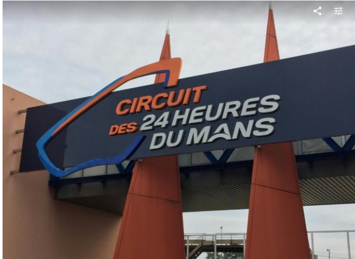
圖 :Le mans 賽車場