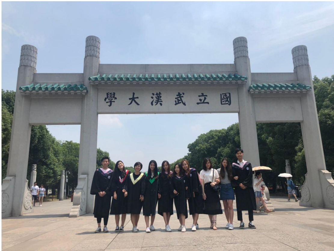
(武大校牌坊。也就是校門口。)

當初會選擇武漢大學(以下簡稱武大)其實是參考中國大陸的大學排行,武漢大學雖不如大家熟知的北京大學、清華大學、浙江大學、復旦大學等等名校有名,但卻在全中國大學排名前十名佔有一席之地,除了排名前面之外,武大是一所綜合型大學,顧名思義,文武百科皆有設院,能讓我進行跨領域的學習,另外武大位於武漢,是較內陸的城市,我想生活花費應較低,能減輕交換花費的負擔,武漢也位於交通要城,若此趟交換能有機會去別的城市參訪,在交通上不論往北往南都很方便。