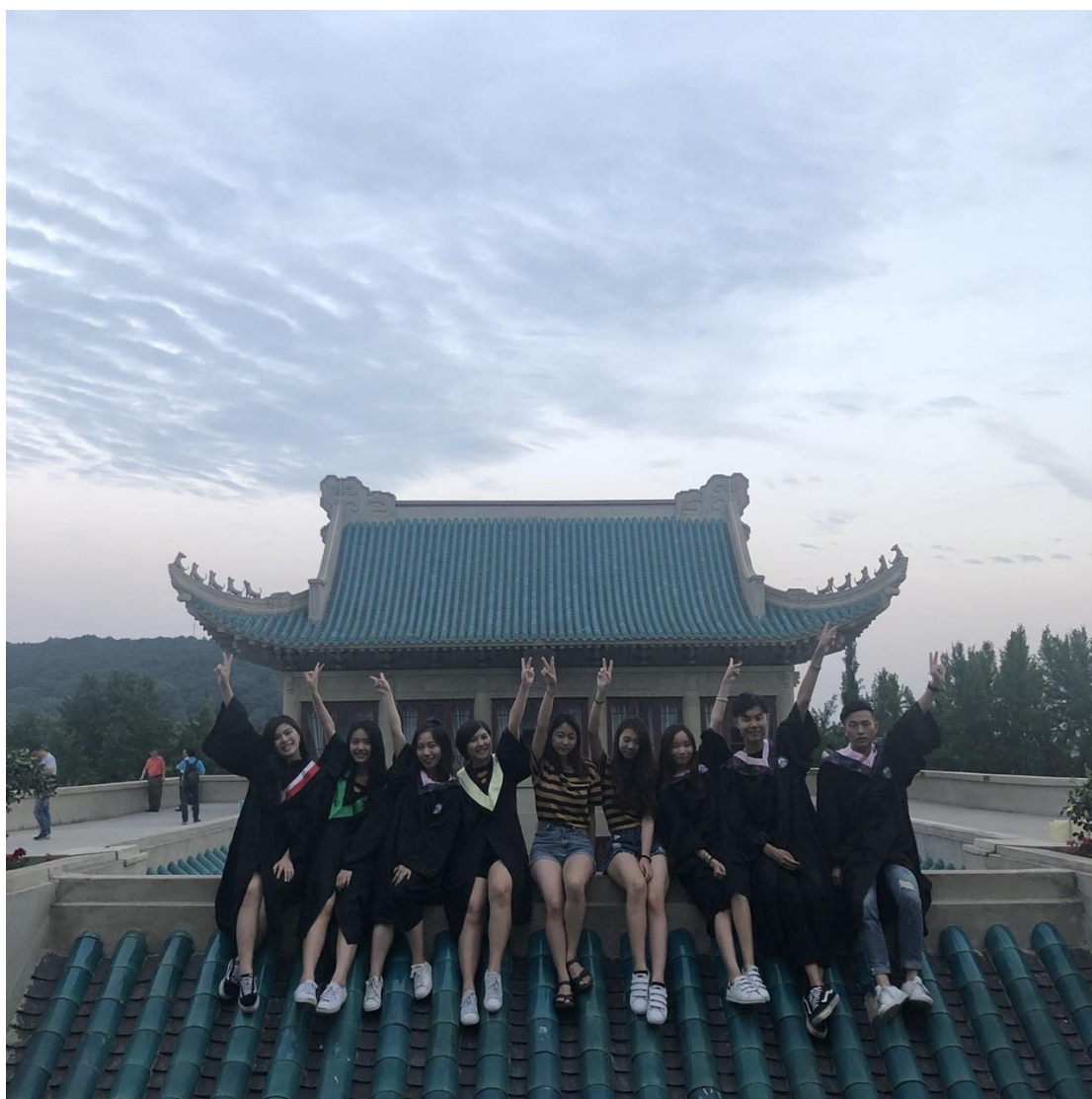
(與最愛的朋友們於櫻頂。)

真的很慶幸當時的自己，把握大學的最後一學期去交換，因為有先把畢業門檻完成，所以沒有學分壓力，帶著一顆輕鬆愉悅的心來武大學習，選擇一些自己有興趣的課，雖然不能說在這短短的一學期獲得了多大的改變，但卻切切實實感受到自己的眼界開闊了，眼光也放的更遠，帶著滿滿的回憶與收穫回到台灣，繼續走人生的下一段旅程。