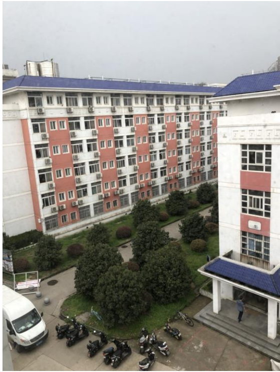
(從湖九五樓拍湖十二。)