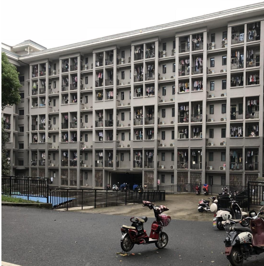
(印象中是楓園宿舍。)