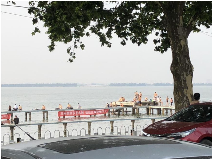
(東湖奇景。在凌波門游泳池游泳戲水的遊客們。)