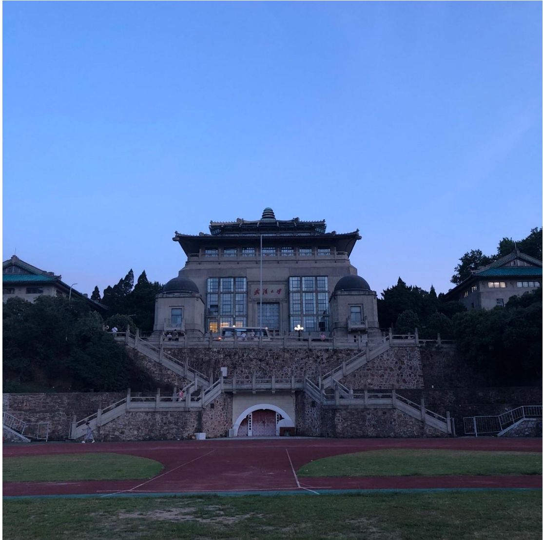
(行政樓與 912 操場。912 操場又被稱作奧操)

武大是一所校域非常寬廣的學校，以我自己切身故事為例，還記得到武大之前，在台灣曾利用 Google map 想稍稍認識武大附近的交通，發現校門口附近就有地鐵站，覺得交通十分方便，到了武大才發現，從宿舍到校門口，走路約要二十分鐘，坐校車也要十分鐘，若是加上排隊等候時間，半小時跑不掉，若從宿舍（湖濱宿舍）步行到上課的教室（最常在教五上課）大約也要 15-20 分鐘，原本以為可以善用大陸最紅的共享單車在偌大的校園中馳騁，但武大校園非常多上坡路，若騎單車大多要下車牽車，增加了車的負擔大概比走路還累，學生還戲稱上學的必經之路為絕望坡。