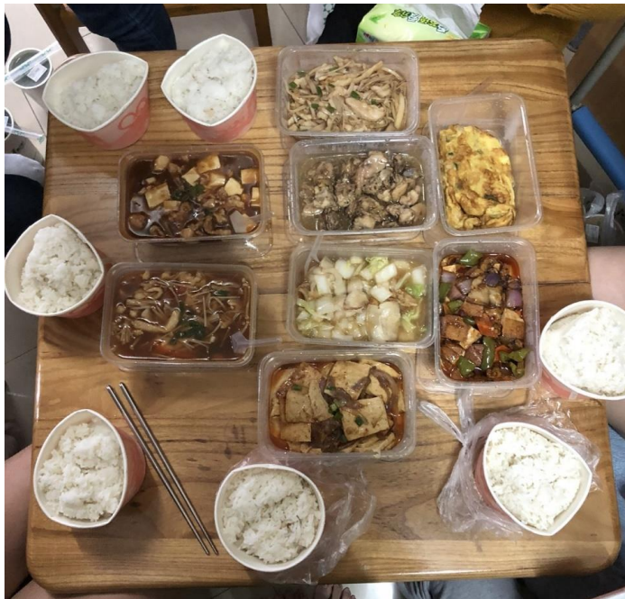
(在宿舍大家一起吃福來。)