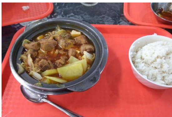
學校食堂的雞排飯以及雞公煲