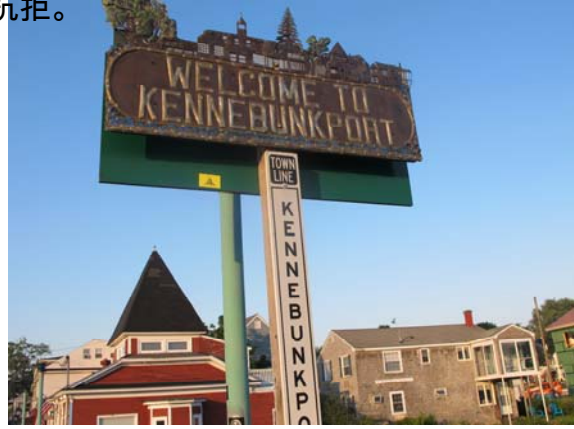
港口是小鎮上最有名的觀光勝地