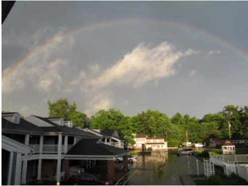
工作飯店下雨後的天空

時間來到七月底，我找到了我的第二份工作：漢堡王速食店的員工。不同類型的工作，一直以來對自己的英文口說自信心不夠，但我覺得在餐廳工作，可以訓練自己的聽力跟口說，在充滿英文的環境中，每天要聽不同口音的客人來點餐，偶爾也要進廚房去做漢堡，雖然上班的時候又累又餓，但每天都在訓練自己的英文聽力，常常用英文和客人對話，對於開口說英文這件事自己也就不再那麼抗拒。