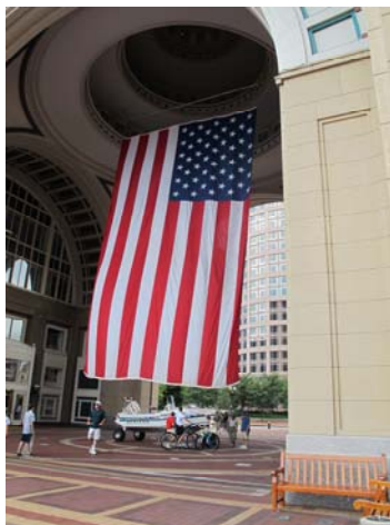
港口旁飄揚的美國國旗