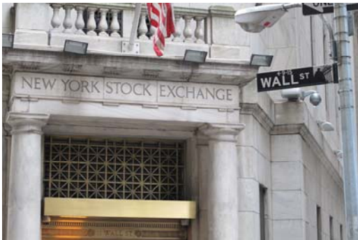
華爾街上的紐約證交所