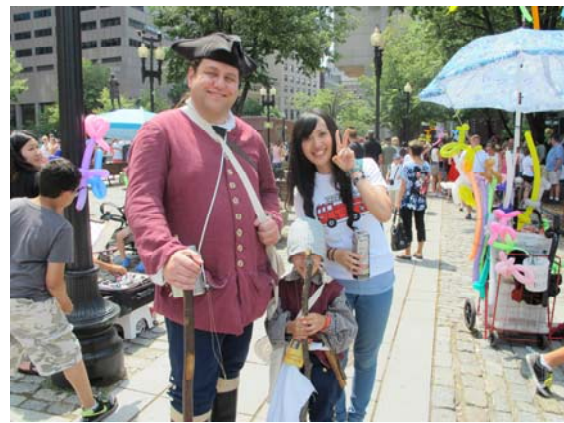
紀念日時街上的人都會裝扮成不同職業