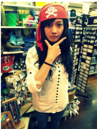
在紀念品店和美麗的海灘上