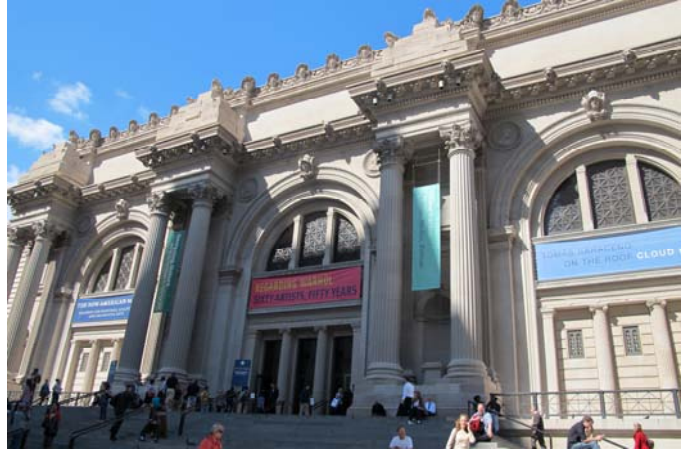
世界三大博物館之一紐約大都會博物館