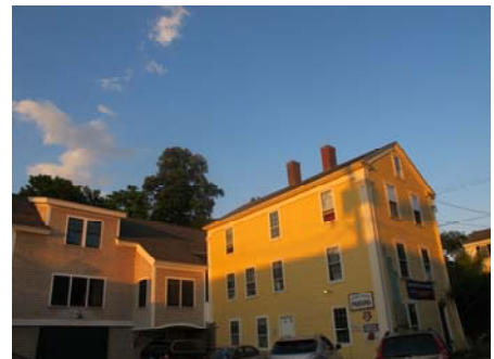
港口邊具有特色的房子