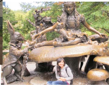
中央公園的愛麗絲雕像