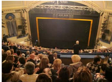
來到紐約一定要去看的百老匯 洋基球場