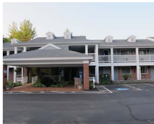
這是我所工作的旅館