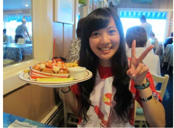
lobster roll 想品嚐鮮美肉質必點