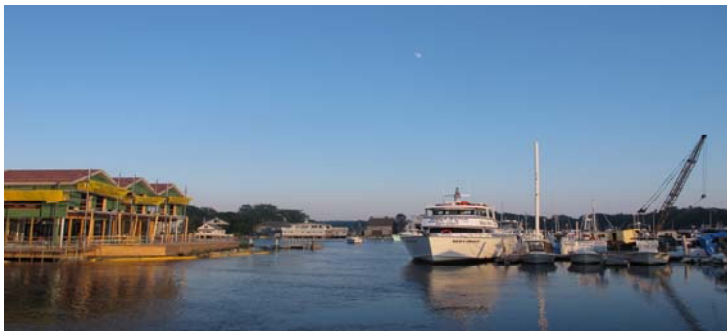
漁船進入港口，這裡盛產龍蝦新鮮又甜美