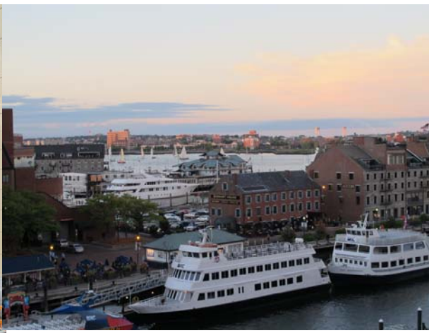
夕陽時分的波市頓港口