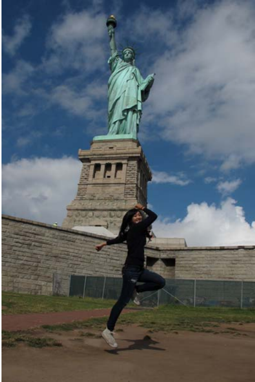
在自由女神像前跳躍

當下既害怕又深刻，不管是再文明或再大的都市，都有社會安全的問題，深夜霓虹燈的誘惑，卻也有可能是致命的誘惑。