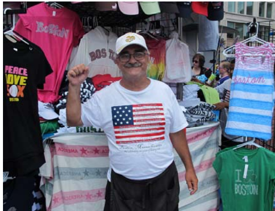
獨立建念日時歡喜的爺爺