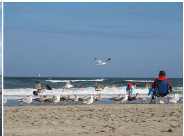
成群的海鷗在海灘上覓食