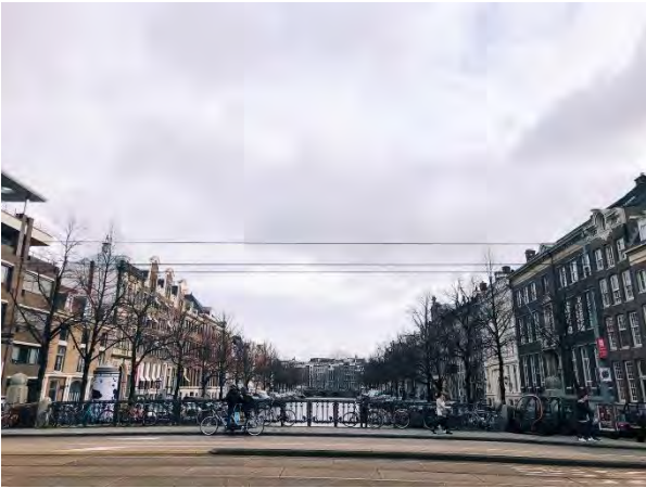
◆ 阿姆斯特丹的運河風景

荷蘭的國王節在 4 月 27 日，前一天晚上稱作 King' s night，許多地方都會舉辦 Festival 來慶祝國王節，在海牙也是，整個市區充滿了人，而在國王節當天，人們會蜂擁至阿姆斯特丹遊行，每個人都會穿上橘色的衣服，也就是荷蘭的代表色，在船上狂歡，是個很特別的體驗，不同於平常，這時候的運河相當的擁擠，大家在船上舞蹈、唱歌、裝扮的誇張，到處充滿了快樂，整個荷蘭都染上了橘色的氛圍。