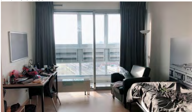
◆ DUWO 宿舍房間內部