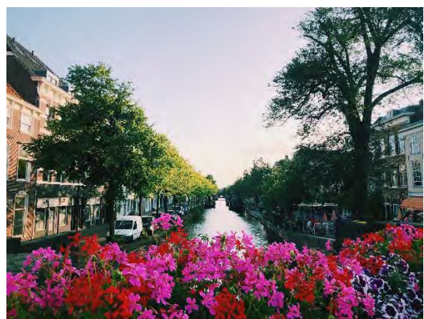
◆ 靠近海牙市中心的運河