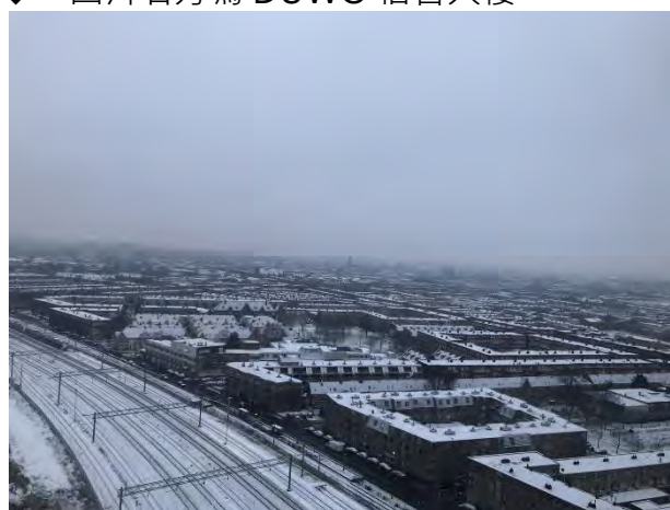
◆ 意外遇見下雪的海牙

海牙科技大學對交換生非常的好，在開學前為交換學生舉辦非常多的聚會，通常都在校園導覽、選課諮詢後帶著所有的交換生在學校附近的餐廳酒吧讓交換生與學校的老師互相交流，雖然 Buddy 的機制在這間學校並不是一對一，但學校舉辦的活動足以讓你在開學前認識一大群朋友。