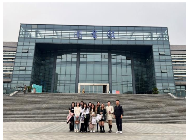
跟河海學生交流的合照