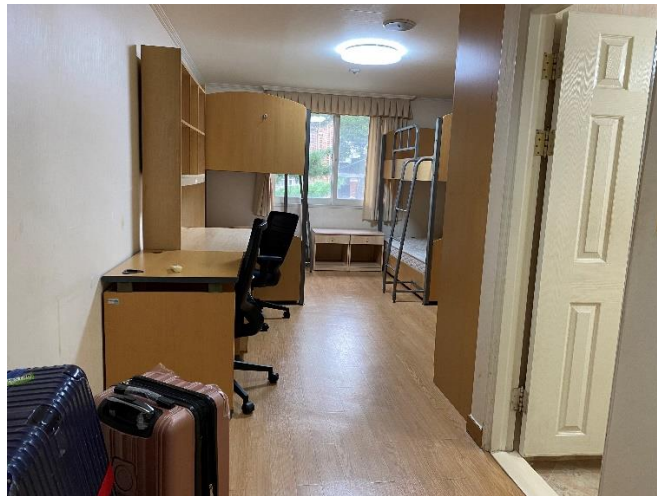
國際一館 4 樓二人房

申請宿舍的國際學生會被分配到與韓國學生分開的國際宿舍，我被分配到的是國際一館的二人房，房內有衛浴，寢具的部分有提供床墊，宿舍內有電梯、洗衣室跟廚房，一樓的辦公室會代收信件跟包裹，不過有聽說其他棟宿舍可能是共用衛浴或是沒有電梯等等，所以不同棟的配置可能不同。宿舍的門禁時間是凌晨1點到5點，並且每周會有兩次清潔檢查，但可以先打掃好，檢查時間不在房內也沒有關係。