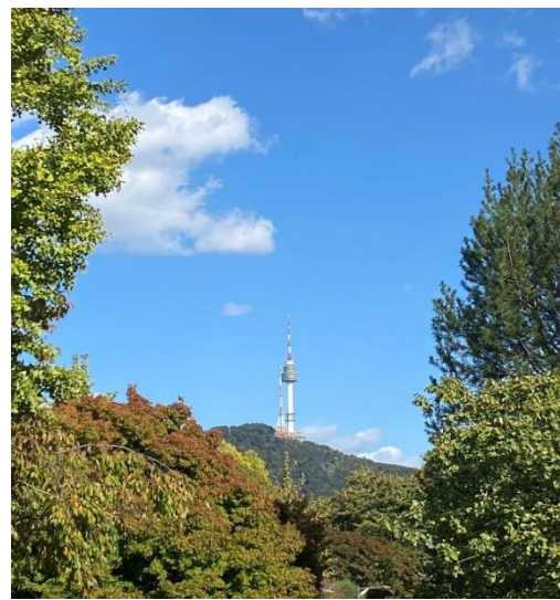
校園內就可遠眺 N 首爾塔