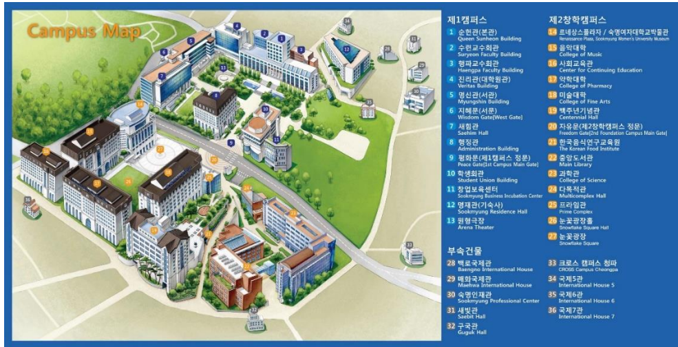
淑明女大校園地圖

淑明女子大學創立於1906年，是韓國第一所私立女子大學。學校位於首爾市龍山區，隔著馬路分成兩個校區，學校食堂、便利商店、影印室及紀念品店集中在北邊的第一校區，第二校區則是有圖書館跟星巴克。兩校區間的青坡路47街連接到地鐵淑明女大入口，沿路有許多餐廳、咖啡廳、超市等商家，是以美食聞名的大學商圈。