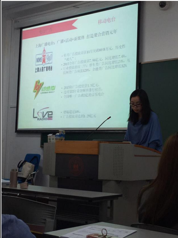
上課實景(同學報告)

上財的同學來自中國各地，不會只有上海的同學。可以透過認識這些同學，對各地民情有幾分了解！教授們也都是來自各行各業的菁英，有些是上課當兼差，平時在業界有工作、有的是致力於教書、做研究、演講，各有各的特色及教法，不過都滿注重課前預習、課後複習，而且很需要學生每周上課前先看好課程大綱然後做好一些預習。