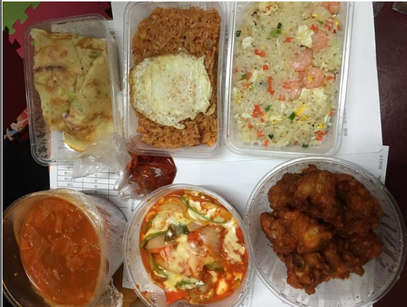
外賣—五人份韓國料理