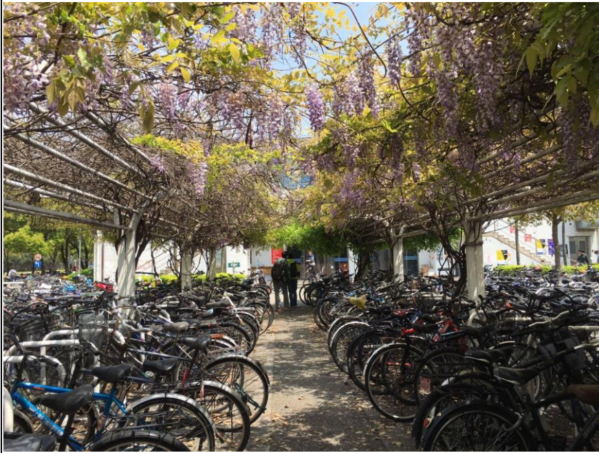
學校裡紫藤花盛開