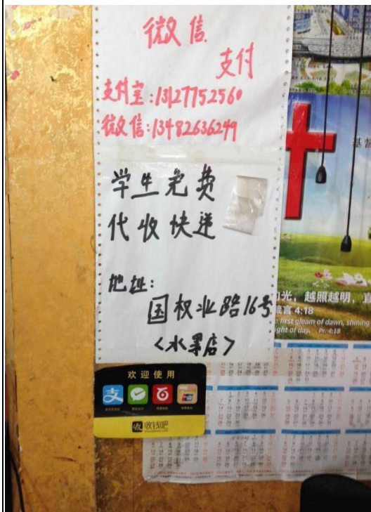
水果店可以拿包裹

一安定好住處，就可以問管理員哪裡可以代收包裹，幾乎每個水果攤都可以代收，一開始會說要收$1 當保管費，但其實只是希望你來拿或順便買水果！