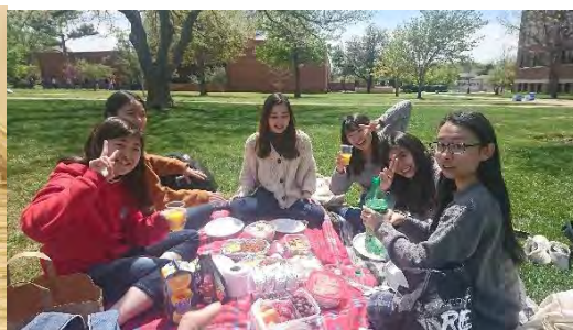
和日本朋友們一起野餐