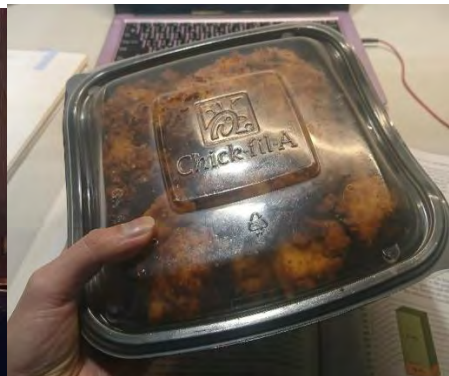
在自習室苦讀半夜， 旁邊速食店送一大盒炸雞