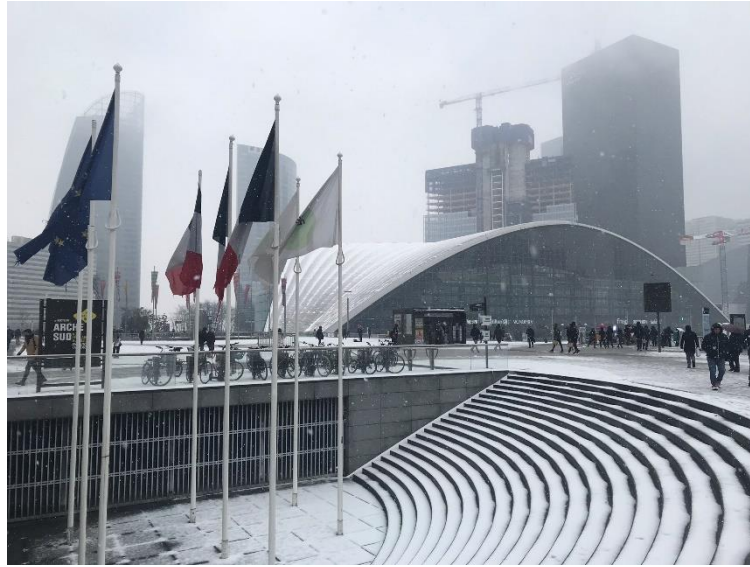
一月下雪中的巴黎金融區 - La Defense