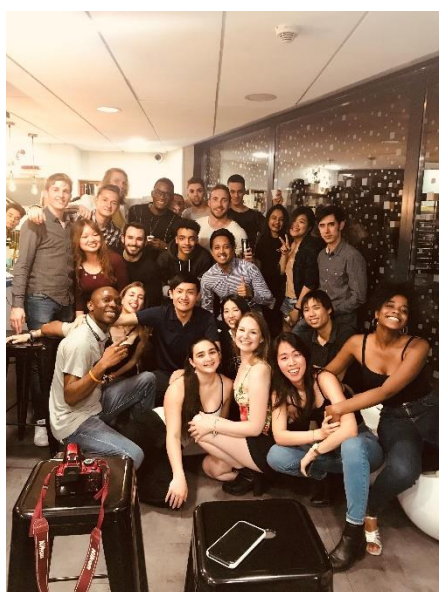
我的生日派對，許多各國好友一同來慶祝！

最後是我對「國際觀」這個名詞的體悟。大部分交換學生或留學生赴外交流的其中一個目的不外乎就是「增進自己的國際觀」，但我過去一直在思考到底「有國際觀」的定義是什麼。經過這三個月的研習交流、自我思考，以及在網路上閱讀一些文章後，我心中慢慢有了一個答案。有些人會覺得有國際觀代表語言能力要好、要遊歷過很多國家、要看起來像有很多國外朋友，但我覺得這都不是重點。國際觀的本質應當是一種「態度」，一種能讓你平等對待世界上不同國家、民族，和文化的態度。除了不鄙視他人外，也不要蔑視自己，從中了解自己並了解他人。尊重差異之餘，更要創造差異！共勉之。