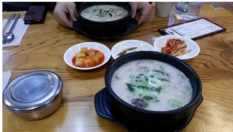
韓國不辣美食: 血腸鍋

另外，韓國餐廳的特色就是小菜有兩三碟以上，當然不外乎都是泡菜、生菜、醃菜，不過都是可以免費無限續加的，如果有好吃的泡菜的時候就可以一直加:)。還有一個特色就是不論春夏秋冬，餐廳都會附一瓶冰水任你喝，這是在台灣餐廳沒有的福利。