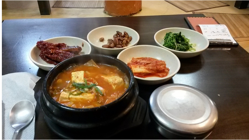
韓國辣美食:豆腐鍋