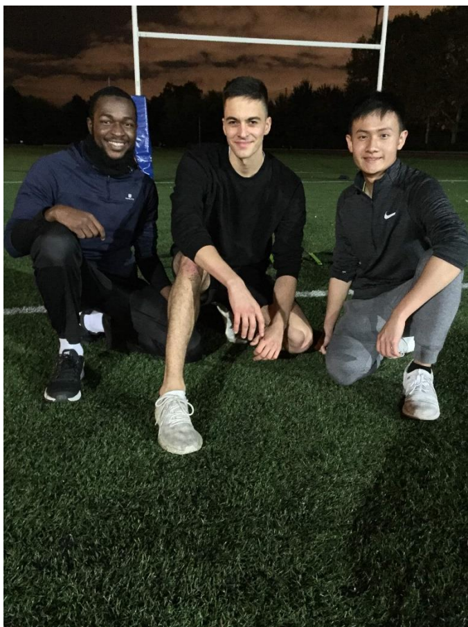
與運動社團的朋友