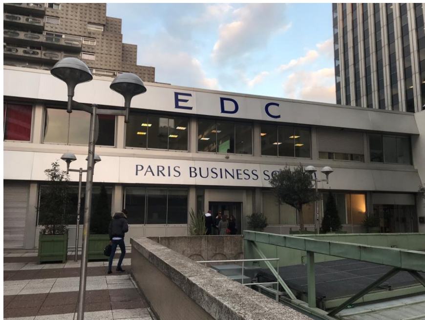
法國巴黎經濟商業高等商學院 (EDC Paris Business School)

課程，直至第四年開始學生可依自己的興趣選修特定學程，分別有行銷管理學程(Marketing Management Program)、財務金融與管理控制學程(Finance & Management Control Program)、國際貿易學程(International Business Program)、國際企業與創業學程(International Entrepreneurship Program)。